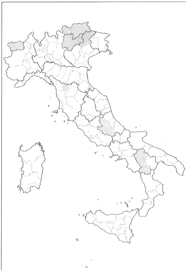
Mappa: Province ricadenti nelle aree a rischio minimo di trasmissione (RM)